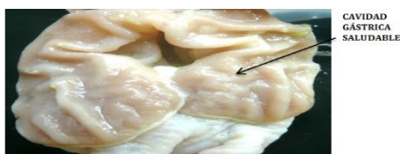
Figura 1. Mucosa gástrica de ratona del conjunto I que recibió solamente una dosis de suero fisiológico mostrando una cavidad gástrica saludable.

En la Tabla 1 el conjunto I (grupo testigo) no mostró daño ulceroso (Figura 1). Referente al grupo control (conjunto II), la superficie total de daño ulceroso fue de 40,91%. En aquellos roedores que fueron ensayados con I. verum L. "anís estrella" más etanol (conjunto III) se percibió una reducción del daño gástrico a una estimación de 8,1 mm 2 lo que indica una disminución del 79,9% encontrándose diferencias significativas ( p < 0,05 ) respecto al conjunto II (control). De la misma manera se halló que al conjunto de animales a los cuales se les administró ranitidina más etanol solo presentó 11,4 mm 2 de decremento de la injuria estomacal mostrando una disminución de 67,8% del área afectada. Se puede afirmar que el conjunto III se mostró significativamente diferente respecto al conjunto IV.