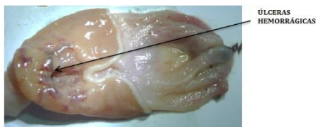
Figura 2. Mucosa del estómago de ratas con etanol exhibiendo ulceraciones hemorrágicas.

La injuria gástrica producida por etanol (grupo control) a la mucosa digestiva de los roedores (figura 2) produjo deterioro y erosión de la misma, estimuló la actividad oxidativa de los radicales libres (por un daño a la mucosa), la lipoperoxidación, el trastorno del ADN y la disminución de concentración de glutatión en la mucosa gástrica de rata (Pérez, 2018). El perjuicio gástrico exhibiría un crecimiento de las citoquinas proinflamatorias las que se ocuparían de detener las acciones de dos enzimas antioxidantes (la superóxido dismutasa y el glutatión peroxidasa) incrementándose la oxidación y la inflamación cualidades inherentes de la gastritis y de la formación ulcerosa en la cavidad gástrica (Fernández, 2014; Castillo et al., 2016; Pareja et al., 2017).