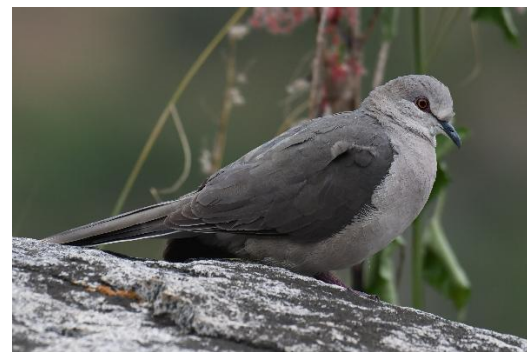
Figura 4. Leptotila verreauxi (Bonaparte, 1855) “pugú”.

Historia sistemática: La especie fue descrita por el naturalista, político y ornitólogo francés Charles Lucien Jules Laurent Bonaparte, II, en el año 1855. El nombre proviene del griego “ leptos ” que significa delgado, fino y “ ptilon ”, ala, plumaje, en alusión a su plumaje esbelto y fino o de apariencia delgada (p. 222); el epíteto de la especie es en honor a los naturalistas y coleccionistas franceses Edouard Verreaux y Jules Pierre Verreaux (p. 400) (Jobling, 2010).