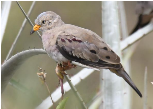
Figura 9. Columbina cruziana (Prévost, 1842) "tortolita"

Historia sistemática: La especie fue publicada por el naturalista e ilustrador francés Florent Prévost en el año 1842. El nombre proviene del latín " columbinus " que hace referencia a columba o "paloma pequeña" (p. 115); el epíteto específico hace referencia a la ciudad de Santa Cruz en Bolivia, que por error tipográfico fue considerada pero la especie no está presente en este país (=presente en la costa de Tacna y Chile) (p. 123) (Jobling, 2010).