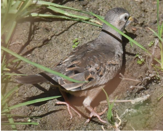
Figura 10. Columbina minuta (Linnaeus, 1766) "tortolita".

intenso. Iris bianular: anillo externo rojizo y un anillo interno blanquecino junto a la pupila de color negro. Pico amarillo o naranja brillante la \frac{1}{2} del área basal, marrón intenso la \frac{1}{2} del área distal. Cera amarillenta. Patas rojizas a rosadas. La hembra con una coloración gris amarillento carece del color azulado en la corona, alas con algunas manchas negruzcas en las cobertoras primarias, secundarias y terciarias.