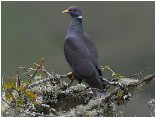
Figura 3. Patagioenas fasciata (Say, 1823) “torcaza de Pagash”, “pugo”.

Historia sistemática: La especie fue descrita por el naturalista, botánico, herpetólogo y entomólogo estadounidense Thomas Say, en el año 1823. Proviene del griego “ patageō ” que significa “repiquear, traquetear, resonar” y “ oinas ” una especie de “paloma” (p. 294); el epíteto de la especie proviene del latín “ fasciatus ”, vendado, con cinta o banda (p. 158) (Jobling, 2010).