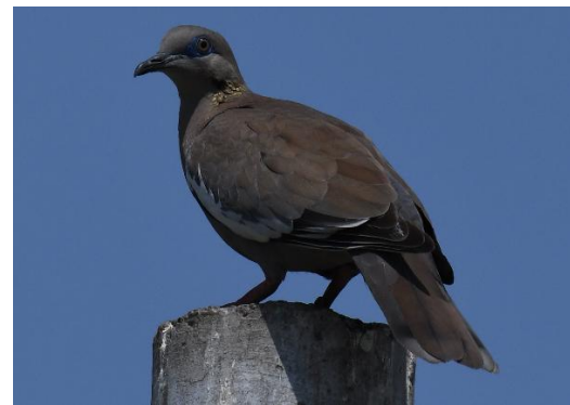
Figura 5. Zenaida meloda (von Tschudi, 1843) “cuculí de Pagash”, “cucula”

Descripción exomorfológica: Bellas aves que miden entre 23-28 cm de longitud, desde el pico hasta la cola. Robusta, plumaje castaño grisáceo con tonos rojizos el manto y dorso. Pecho gris claro o rojizo iridiscente, área anal blanca. Alas con las remeras primarias gris intenso, con los bordes o ribetes blancos mayor amplitud los externos, apreciable cuando están plegadas o en vuelo, las cobertoras primarias marrón, con amplio borde externo blanco. Cola con las supracaudales gris intenso con una banda subterminal blanca. Subcaudales negro los \frac{3}{4} del área basal, blanco el \frac{1}{4} del área distal, se nota cuando vuela. Cabeza con la frente, corona y nuca gris. Garganta blanquecina o crema. Cara con la mejilla y área malar gris. Aurículas grises. Parche amarillo iridiscente en los laterales del cuello. Periocular azul intenso o azul cobalto, es muy notorio. Iris bianular: anillo externo gris y un anillo interno junto a la pupila gris claro a beige. Pupila negra. Pico negro. Patas rojas o rosadas. El macho con parche iridiscente en ambos lados del cuello presenta la corona azulada.