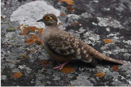
Figura 7. Metriopelia ceciliae (Lesson, 1845) "tortolita peruana".

marrón grisáceos. Garganta blanca. Cara con la mejilla y área malar marrón blanquecino. Aurículas marrón blanquecinas. Piel desnuda alrededor del ojo muy notorio amarillo intenso o naranja rojizo. Pequeña línea media luna supraocular blanca. Iris bianular: anillo externo gris negruzco y un anillo interno próximo a la pupila blanquecino. Pupila negra. Pico negro. Cera negra. Patas rosadas.