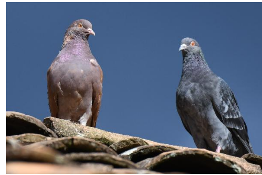
Figura 2. Columba livia (Gmelin, 1789) “paloma doméstica”, “paloma de castilla”.

Alimentación: Se alimentan siempre en el suelo, de “maíz” Zea mays , “trigo” Triticum aestivum (Paceae), “alverjas” Lathyrus oleraceus (Fabaceae), así como de migas de pan, o restos de comida. Generalmente, beben agua después de alimentarse, introduciendo el pico dentro del agua hasta saciarse.