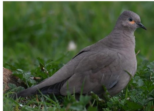
Figura 8. Metriopelia melanoptera (Molina 1782) "tortolita del Gran Shamana".

Descripción exomorfológica: Aves tímidas, miden entre 18-23 cm de longitud, desde el pico hasta la cola. Manto y dorso marrón grisáceo con manchas cremas en la rabadilla. Pecho hasta el área anal castaño claro o beige. Alas con las remeras primarias gris intenso, con los bordes o ribetes beige, cobertoras primarias marrón, con los bordes o ribetes castaño claro u ocre claro; escapulares blancos, visibles cuando están en vuelo. Cola con las supracaudales gris intenso, rectrices con los bordes externos negros, visible cuando están en vuelo. Subcaudales blanquecinas. Cabeza con la frente, corona y nuca marrón grisáceos. Garganta blanquecina. Cara con la mejilla y área malar marrón grisáceo. Aurículas blanquecinas. Piel desnuda del área anterior e inferior (media luna) de los ojos amarillo-anaranjado. Anillo periocular blanquecino. Iris bianular: anillo externo negruzco y un anillo interno próximo a la pupila levemente azulado. Pupila negra. Pico negro. Cera negra. Patas negruzcas.