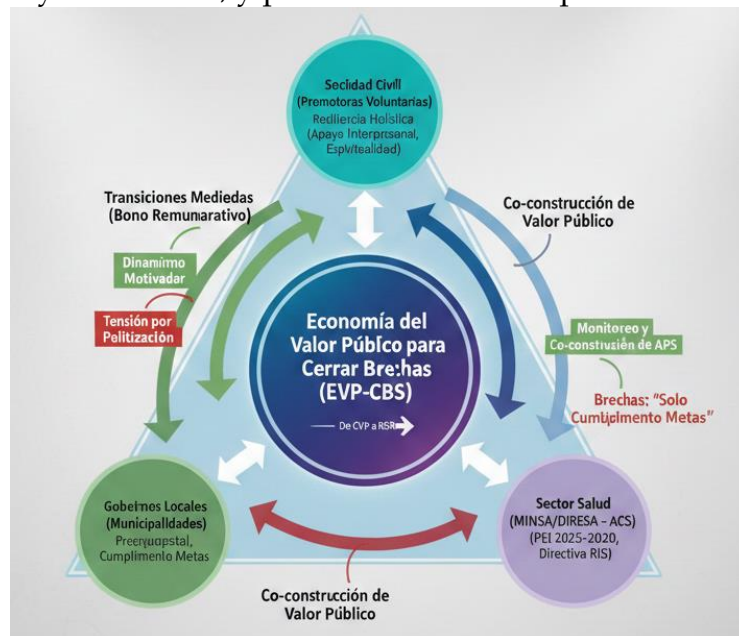
Figura 2. Aproximación Teórica de un Modelo de Gestión Territorial de la Salud

Una aproximación teórica de un modelo de gestión territorial de la atención primaria de la salud, debe considerar a. los componentes de integración resiliente de roles voluntarios, b. el gerenciamiento de condicionantes gestionable de la implementación efectiva de las consejerías, c. la reducción de los tiempos de espera entre cada una de las citas de las madres gestantes, y d. la institucionalización de los servicios de cuidados de enfermería, tanto para el voluntariado, así como para las madres en su estado de gestantes, parturientas y cuidadoras, y para el RN hasta sus primeros tres años.